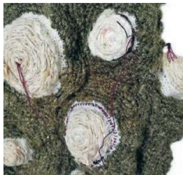
Monique Aubertijn, Nest #1 (detail) .

11 en 12 juni. Alle informatie is ook te vinden op textiefestivalweerribben.nl . Volg ons op facebook en instagram.