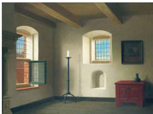
Bovenzaal van de Weem in Westeremden, 2006.

Museum Helmantel is gevestigd in een geheel gereconstrueerde Weem; een pastorieboerderij