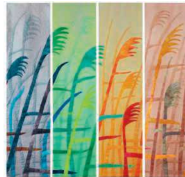
Rineke van Zeeburg.

Toegangsprijs: € 15,00, inclusief festivalboek met alle informatie voor drie dagen. Andere mogelijkheid: duokaart (2 pers.) plus 1 festivalboek: € 25,00. Tickets zijn online verkrijgbaar via de website en bij MFC Dalzicht te Oldemarkt op 10,