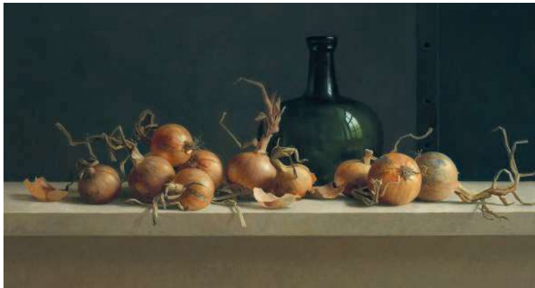
Uienstilleven met grote fles, 2021.

oorspronkelijk uit de 13de eeuw en is gelegen op een prachtige locatie, boven op de kruin van de wierde. De herbouw vond in verschillende fases plaats tussen 1974 en 2004 en blijft een schitterende plaats om het werk van Helmantel te tonen. De grote tuin rondom de Weem is vrij toegankelijk en hier kunnen bezoekers bij mooi weer genieten van een gratis kop koffie of thee.